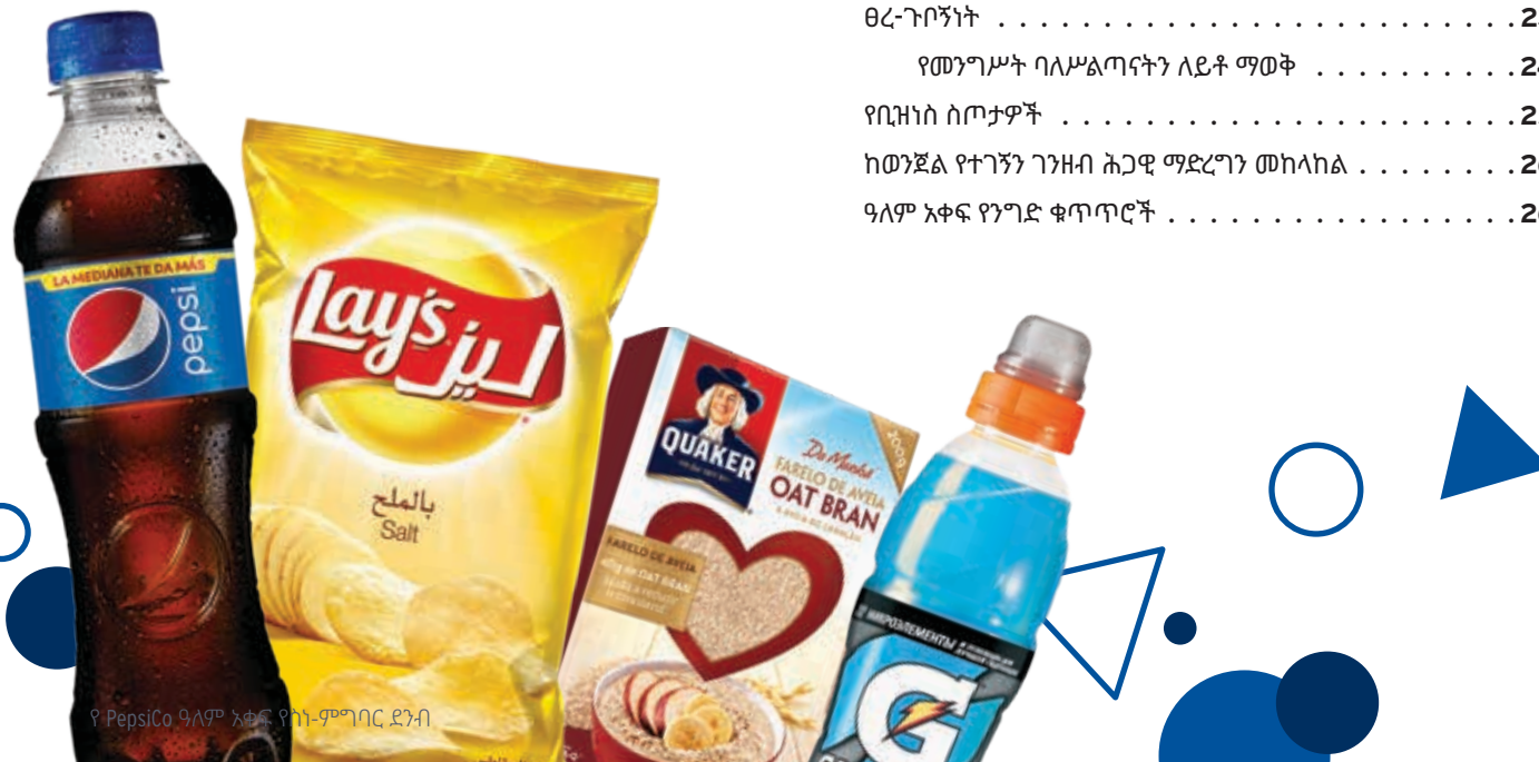
የPepsiCo ዓለም አቀፍ የስነ-ምግባር ደንብ