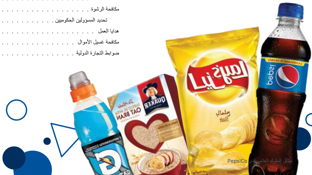
ميثاق السلوك العالمي لدى PepsiCo

قسم الشؤون القانونية في PepsiCo . . . . . 42